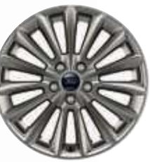
Jante de 17" din aliaj Rock Metallic

Focus ST-Line de culoare Candy Red* cu jante de 18" din aliaj, Rock Metallic. Focus ST-Line de culoare Moondust Silver* cu jante de 18" din aliaj, Rock Metallic.