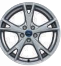
Jante de 18" din aliaj