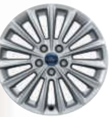
Jante de 17" din aliaj