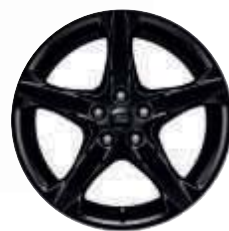
Jante de 18" din aliaj negru Shadow cu 5 spițe (opțiune)

Focus ST-Line Red & Black (roșu) cu jante de 18" din aliaj negru Shadow. Focus ST-Line Red & Black (negru) cu jante de 18" din aliaj negru Shadow.