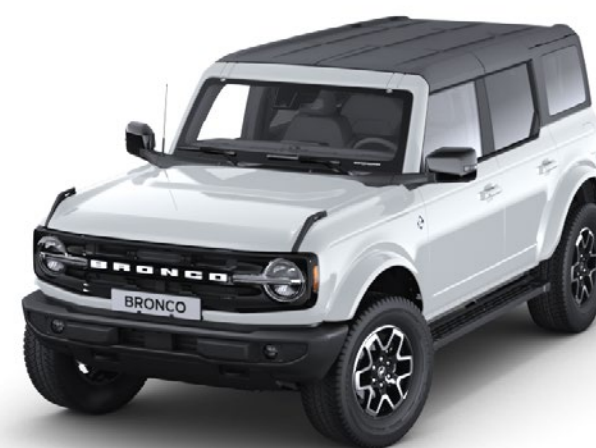
Culoare caroserie Oxford White nemetalizat