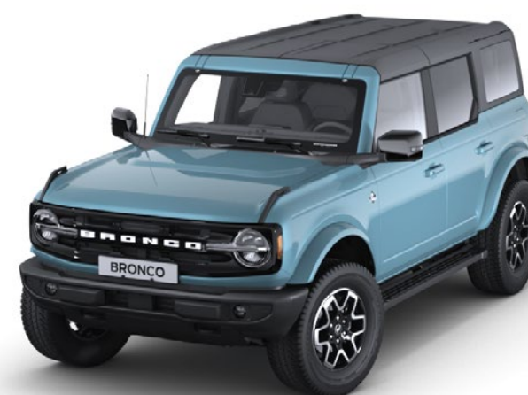
Culoare caroserie Area 51 nemetalizat*