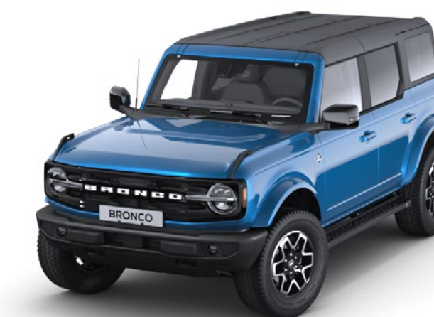
Culoare caroserie Velocity Blue metalizat*