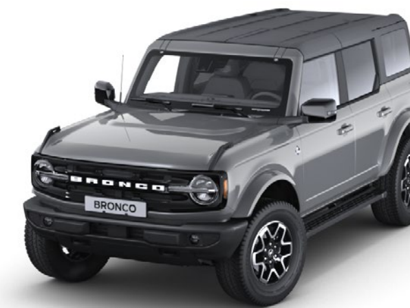
Culoare caroserie Carbonized Grey metalizat*