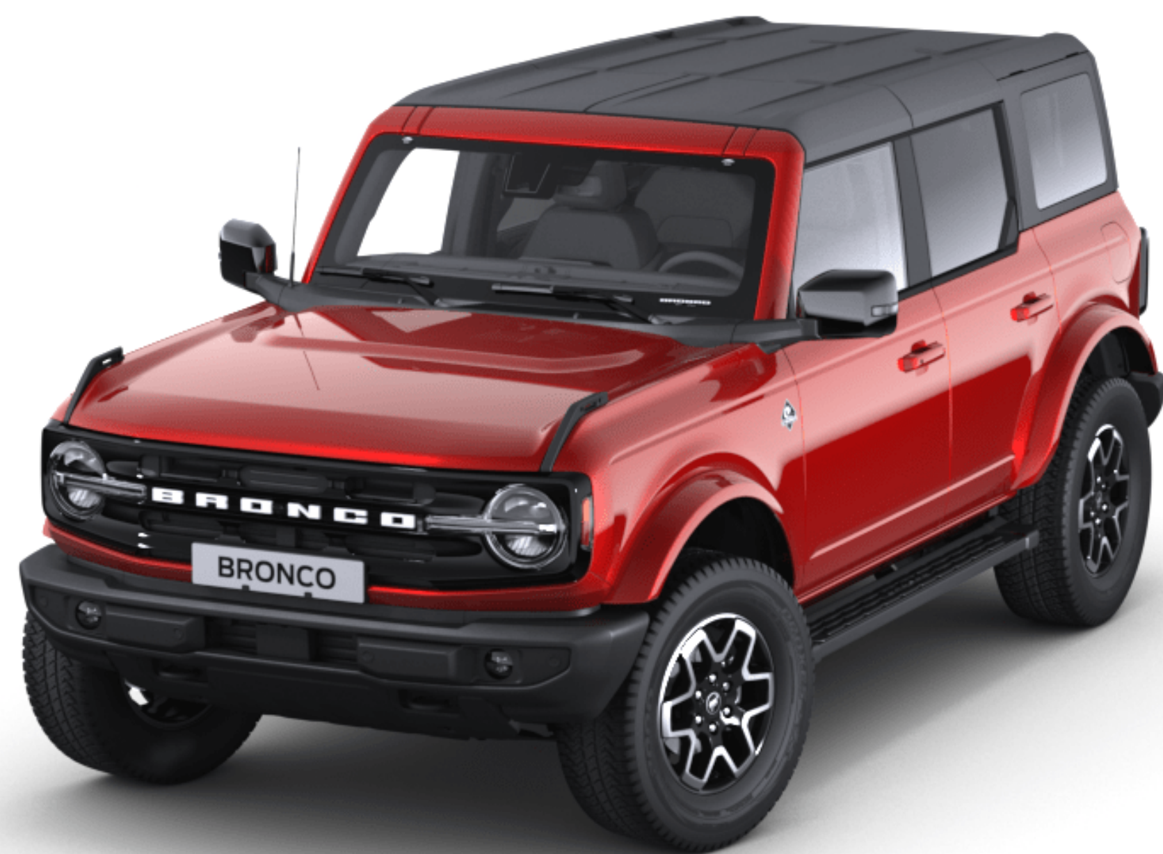
Culoare caroserie Red Hot Pepper metalizat, clară și cu tentă*

Durabilitatea exteriorului mașinii Ford Bronco se datorează unui proces special de vopsire în mai multe etape. Părțile caroseriei din oțel injectate cu ceară, un strat de acoperire și procedurile de aplicare asigură faptul că noul tău Bronco își va păstra aspectul pentru mult timp.