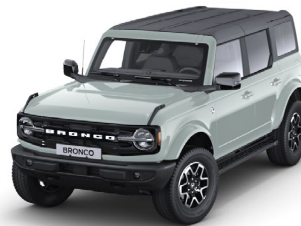
Culoare caroserie Cactus Grey nemetalizat*