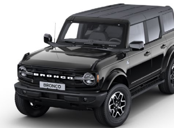
Culoare caroserie Shadow Black metalizat*