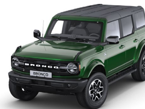
Culoare caroserie Eruption Green metalizat*