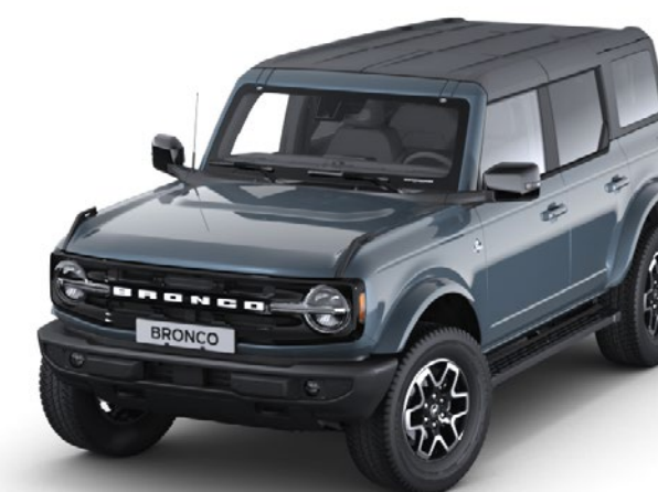
Culoare caroserie Azure Grey metalizat*