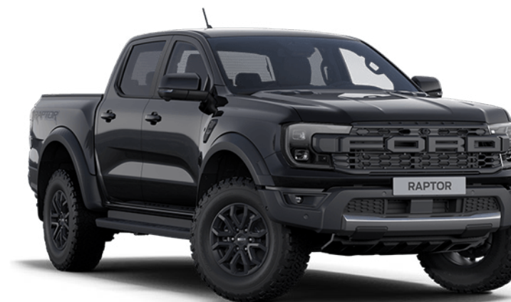
Absolute Black † Vopsea metalizată