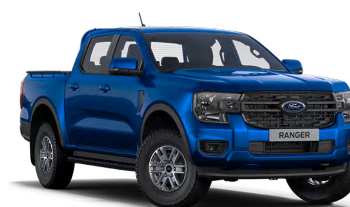
Blue Lightning † Vopsea metalizată

Notă: Imaginile sunt folosite numai pentru a ilustra diferite culori ale caroseriei și este posibil să nu reflecte autovehiculul descris. Culoarele și tapițeriile reproduse în această broșură pot să difere de culorile reale din cauza limitărilor procesului de tipărire folosit. Unele culori de caroserie sunt opțiuni și sunt disponibile contra cost.