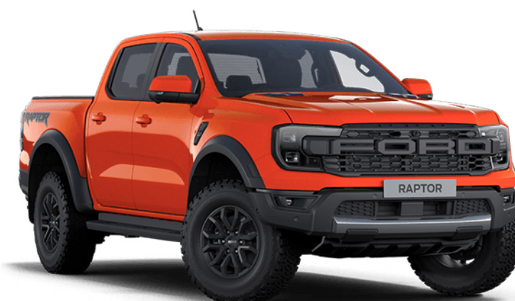
Code Orange † Vopsea nemetalizată