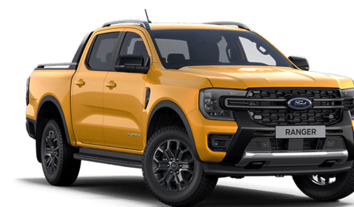
Cyber Orange †† Vopsea metalizată specială