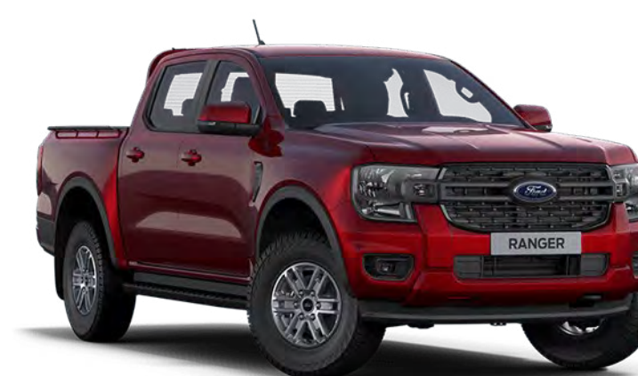
Lucid Red †† Vopsea metalizată