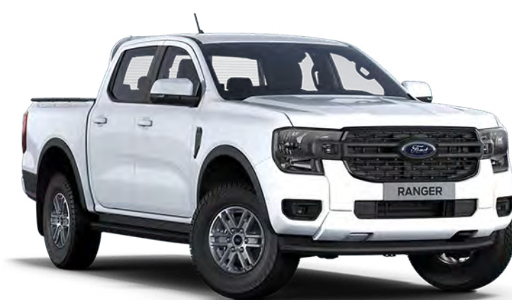
Frozen White †† Vopsea metalizată