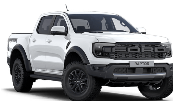
Arctic White † Vopsea nemetalizată