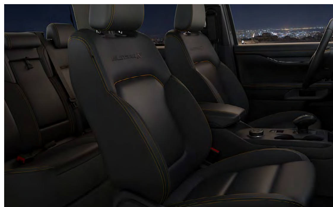
Parțial Piele Soho (piele) de culoare Ebony/Sensico®/Miko Suede (material) in Ebony Standard pe Wildtrak X