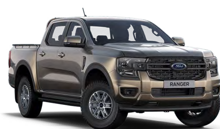
Diffused Silver ††† Vopsea metalizată