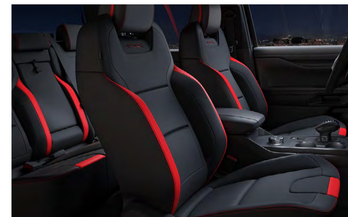
Piele Super Matte și piele întoarsă Dinamica Auto Miko de culoare Ebony (cu accente Code Orange) Standard pe Raptor

Notă Sensico® este o marcă comercială Ford EU pentru tapițerie sintetică premium, dezvoltată pentru interiorul autovehiculelor. Fiind o tapițerie vegană, combină o senzație premium, moale, este durabilă și are un aspect deosebit. Nu necesită întreținere, este ușor de curățat și este protejată împotriva petelor și a mirosurilor. Cu un aspect de înaltă calitate, Sensico® nu numai că te simți confortabil când stai pe ea în timpul unei călătorii lungi, ci ai și conștiința împăcată, știind că nu este de origine animală. Este un design care oferă liniște sufletească pentru conducătorii auto moderni și aspiranți.