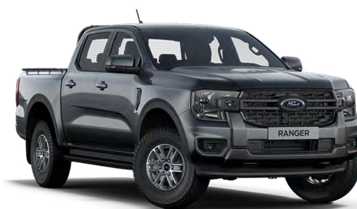
Carbonized Grey †† Vopsea metalizată