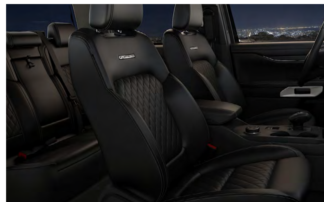
Piele Premium – Quilt & Embellish Registered Perf over Edition Grain/Luxury Grain in Ebony Standard pe Platinum