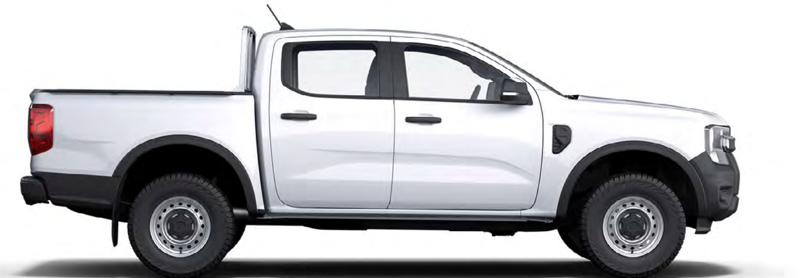
RANGER CABINĂ DUBLĂ