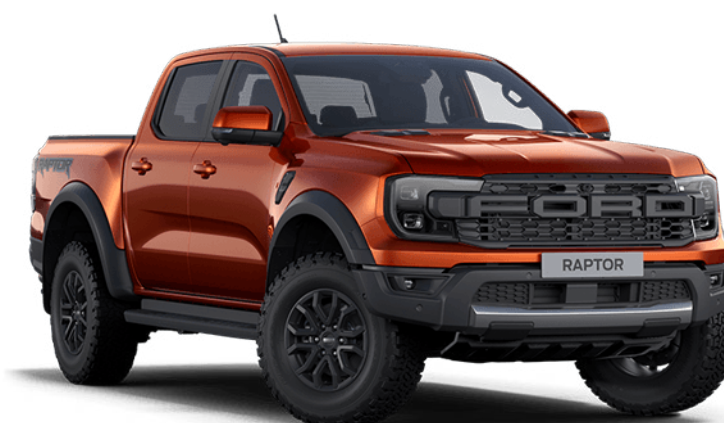
Sedona Orange † Vopsea metalizată