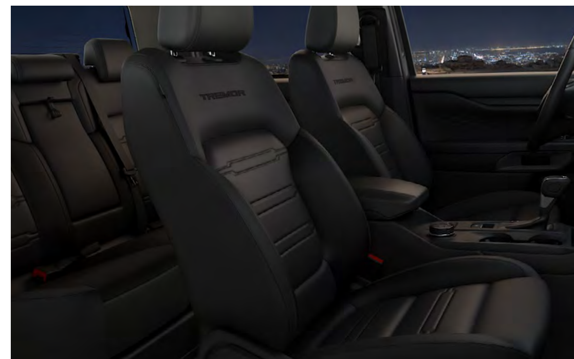
Tremor vinilin (Sensico®) – Soho Grain/Heavy Tech de culoare Ebony Standard pe Tremor