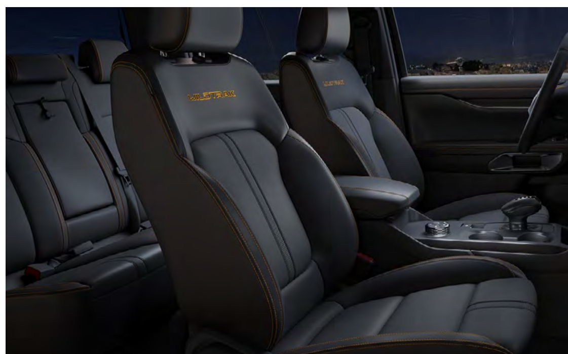
Partial leather trim – Microrib Embossed/Soho/Foundation/Soho in Ebony Standard pe Wildtrak