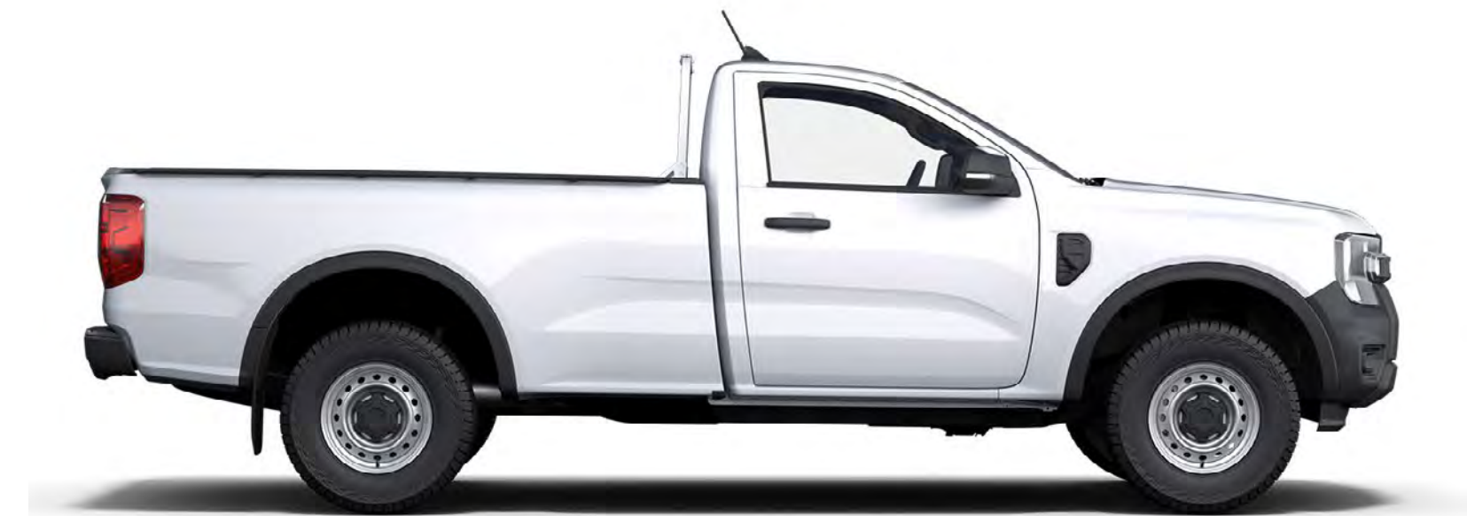
RANGER CABINA SIMPLĂ

Cu o gamă variată de caroserii, împreună cu opțiuni de personalizare a exteriorului și interiorului, există un Ford Ranger potrivit pentru tine.