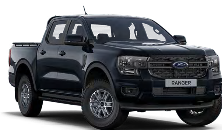
Agate Black †† Vopsea metalizată