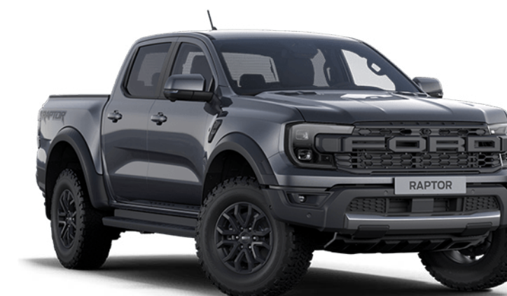
Meteor Grey † Vopsea metalizată