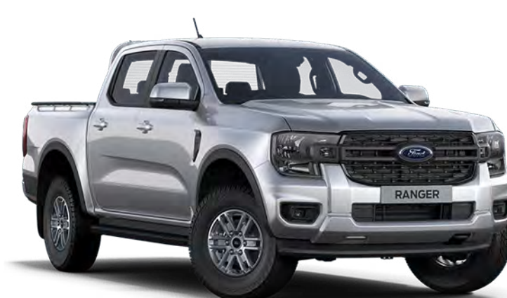
Moondust Silver †† Vopsea metalizată