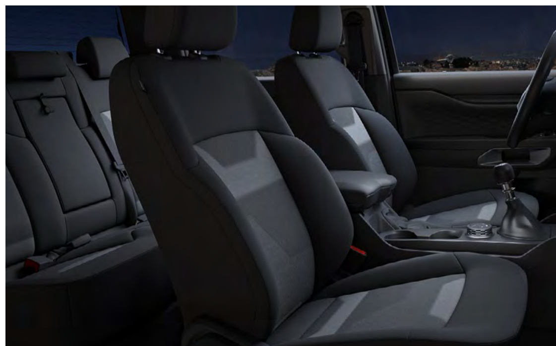
Material de accentuare de culoare Ebony Standard pe XL