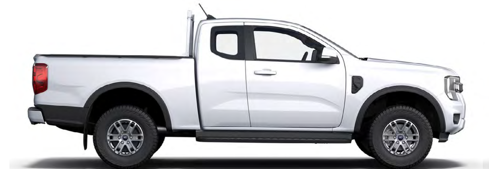
RANGER CABINĂ EXTINSĂ