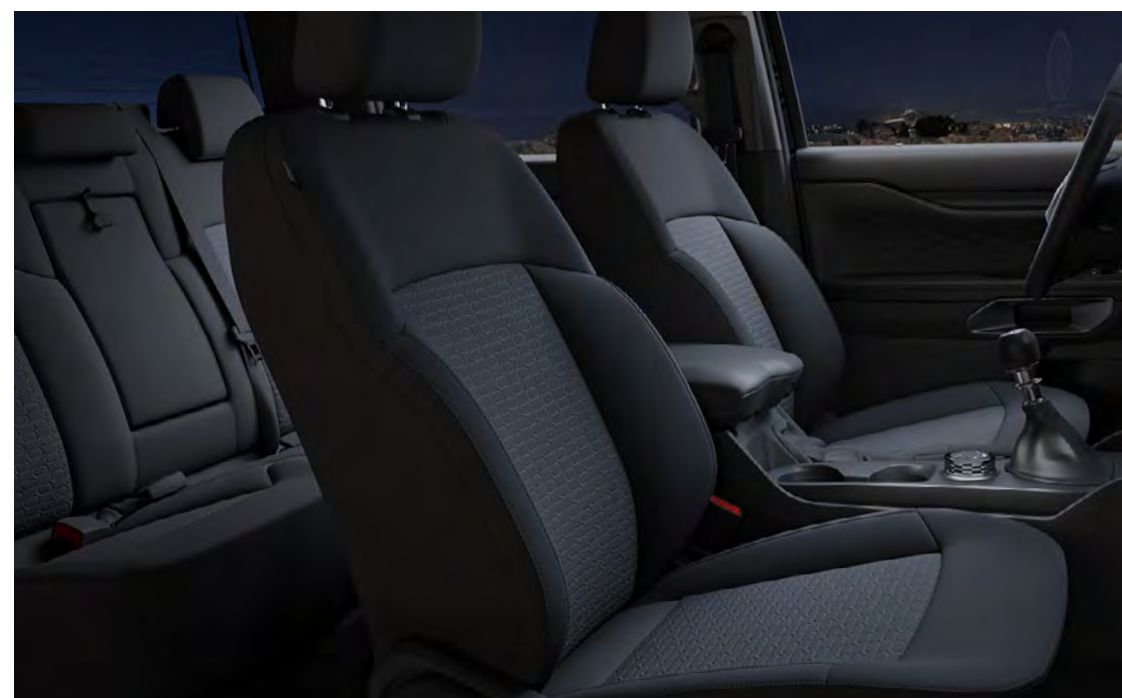
Textil City (Elevate-ștanșat) pe Ebony Standard pe XLT