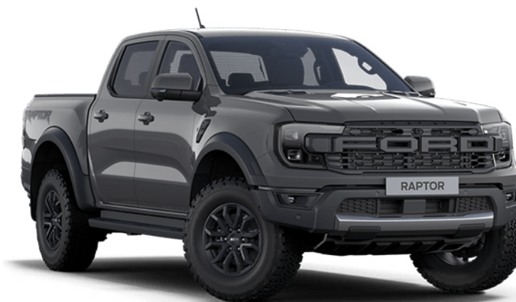
Conquer Grey ††† Vopsea nemetalizată